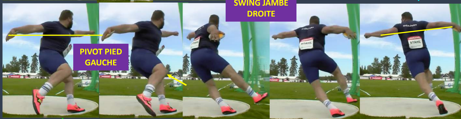
PIVOT PIED GAUCHE