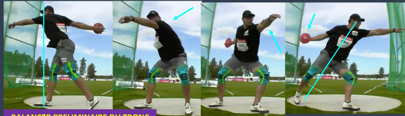
BALANÇER PRELIMINAIRE DU TRONC