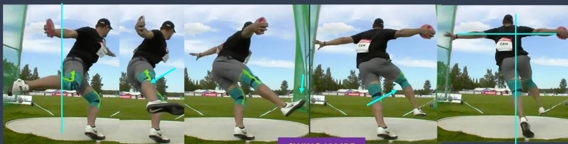
SWING JAMBE DROITE