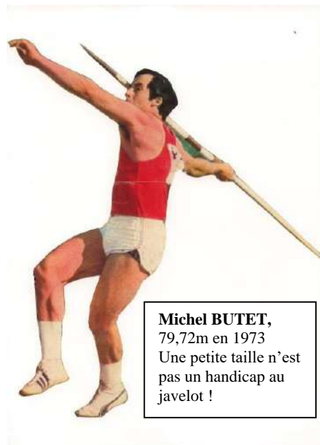
Michel BUTET, 79,72m en 1973 Une petite taille n'est pas un handicap au javelot !

Michel MACQUET lors de son 1 er record de France à 64,60m en 1954 reste indiscutablement le meilleur lanceur de Javelot Français de tous les temps et aurait mérité la consécration d'un record ou d'un podium international.