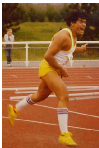
Jean Paul LAKAFIA 86,60m* (1985) Champion France 83-84 2 records de France : 83,56m -84,74m Finaliste Olympique Los Angeles