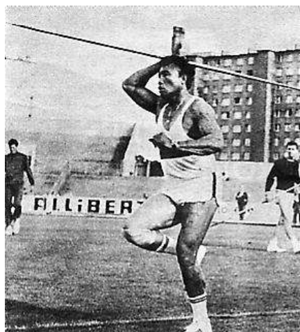
Petelo WAKALINA 80,16m* (1966) Champion France 66 et 68