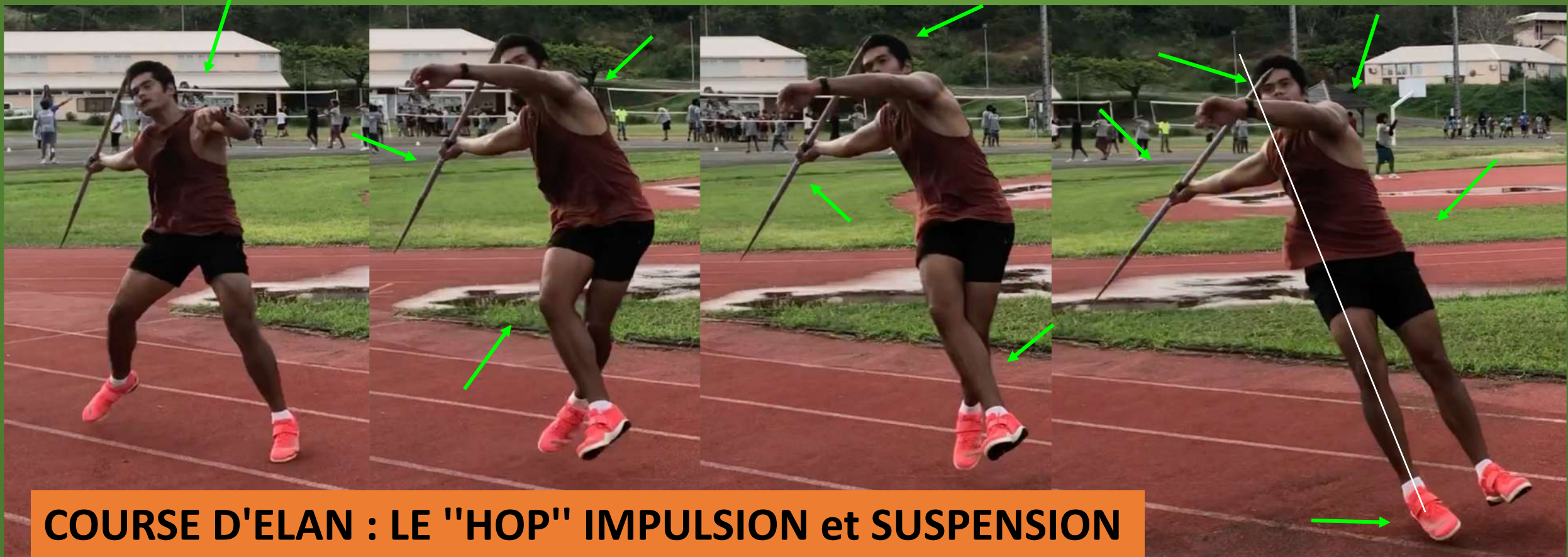
COURSE D'ELAN : LE "HOP" IMPULSION et SUSPENSION

Le "hop" a été bien préparé par les foulées d'approche . Il y a une impulsion bien contrôlée de l'appui gauche . La jambe et le genou gauches attaquent vers le haut et l'avant mais sans forcer exagérément le geste . La position pendant la suspension et avant la reprise d'appui est absolument remarquable . Le javelot n'a pas bougé . L'inclinaison du corps est importante mais pas exagérée . Avant la pose pied droit (noter que la pointe du pied rentre bien à l'intérieur pour faciliter la réaction à la pose) , les deux pieds sont proches l'un de l'autre et le pied gauche déjà un peu en avant . Parfait ! .