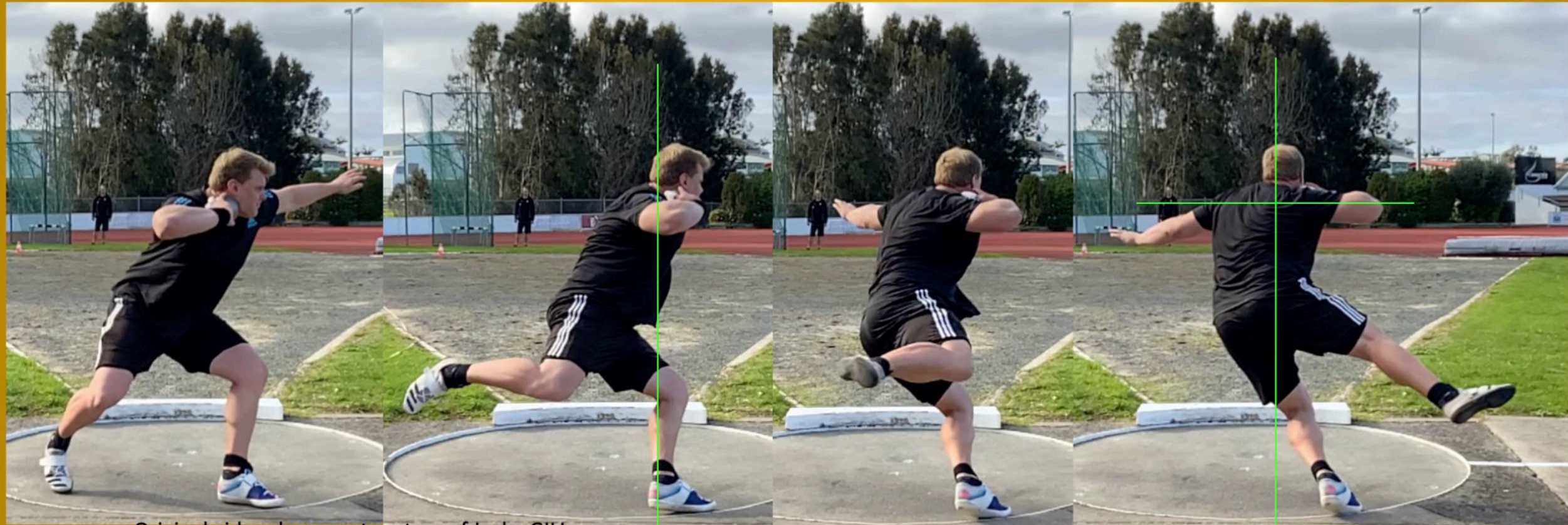
Original video document curtesy of Jacko GILL