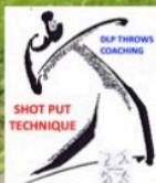
Original video document curtesy of Jacko Gill